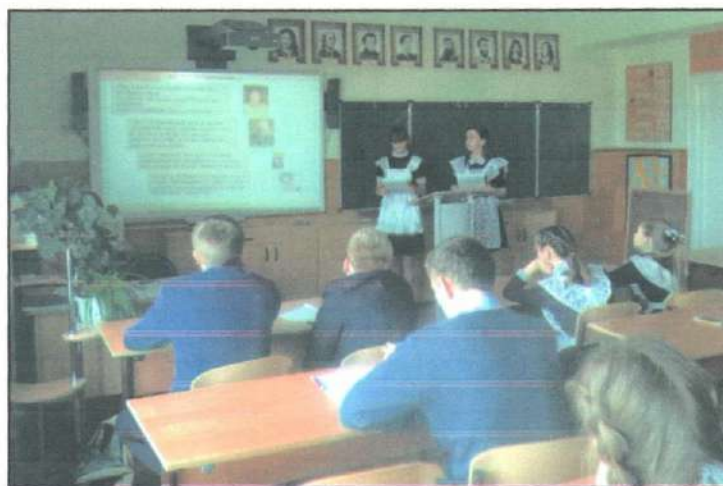
VI научно – практическая конференция «Мы и время – ВМЕСТЕ».