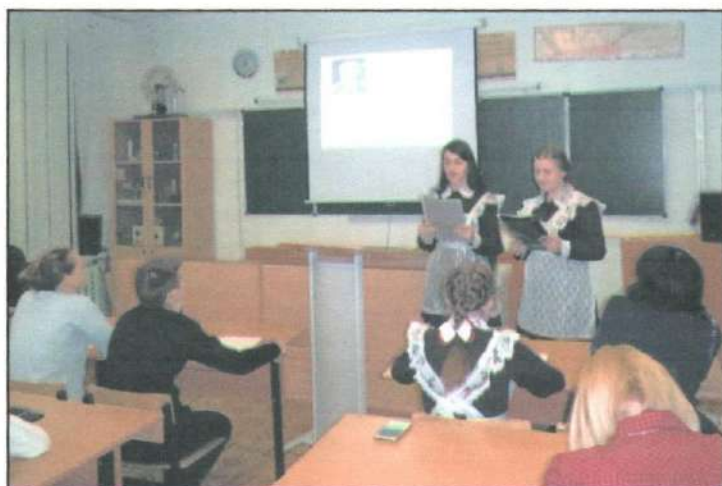
V научно – практическая конференция «Мы и время – ВМЕСТЕ».